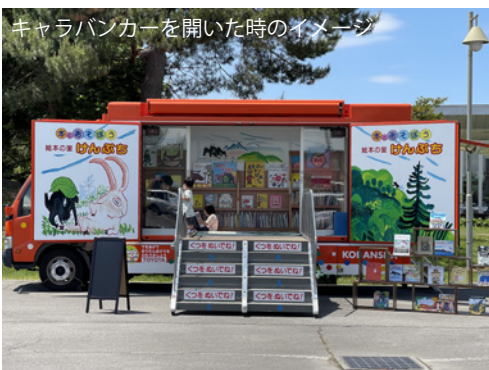
キャラバンカーを開いた時のイメージ

今から 30 年ほど前に設立し、剣淵町を絵本の里として有名にするため様々な活動をしております。